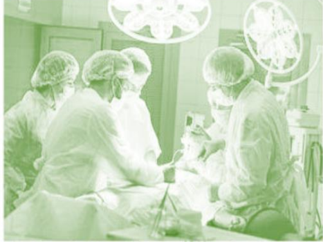
ટ્રોમા સેન્ટરમાં દર્દીની આકસ્મિક શસ્ત્રક્રિયા થાય છે ત્યારની તસવીર.

ટ્રોમા દિવસે જી. કે. જનરલ અદાણી હોસ્પિટલના તબીબોએ મહત્વ સમજાવ્યું